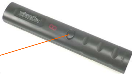
SW1 Select / confirm button